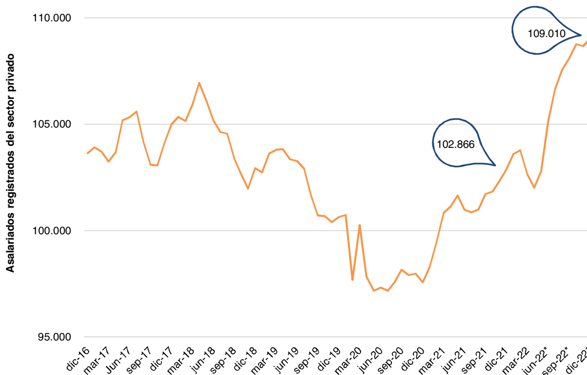
Gráfico 2. Asalariados registrados del sector privado. Serie desestacionalizada (1) . Período diciembre 2016–diciembre 2022