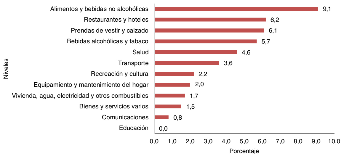
Gráfico 1. IPC variación mensual según divisiones. Región Noreste. Período diciembre 2020 – noviembre 2020.